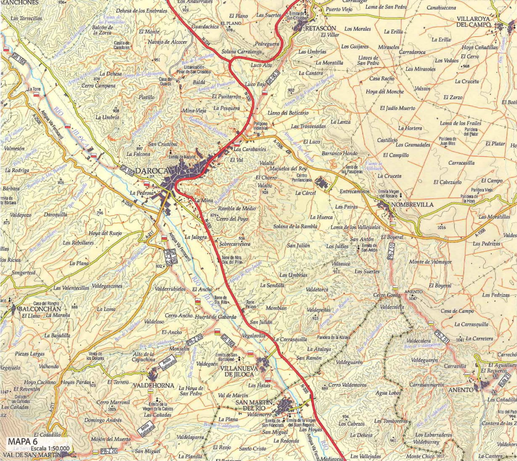
MAPA 6 Escala 1:50.000 VAL DE SAN MARTÍN