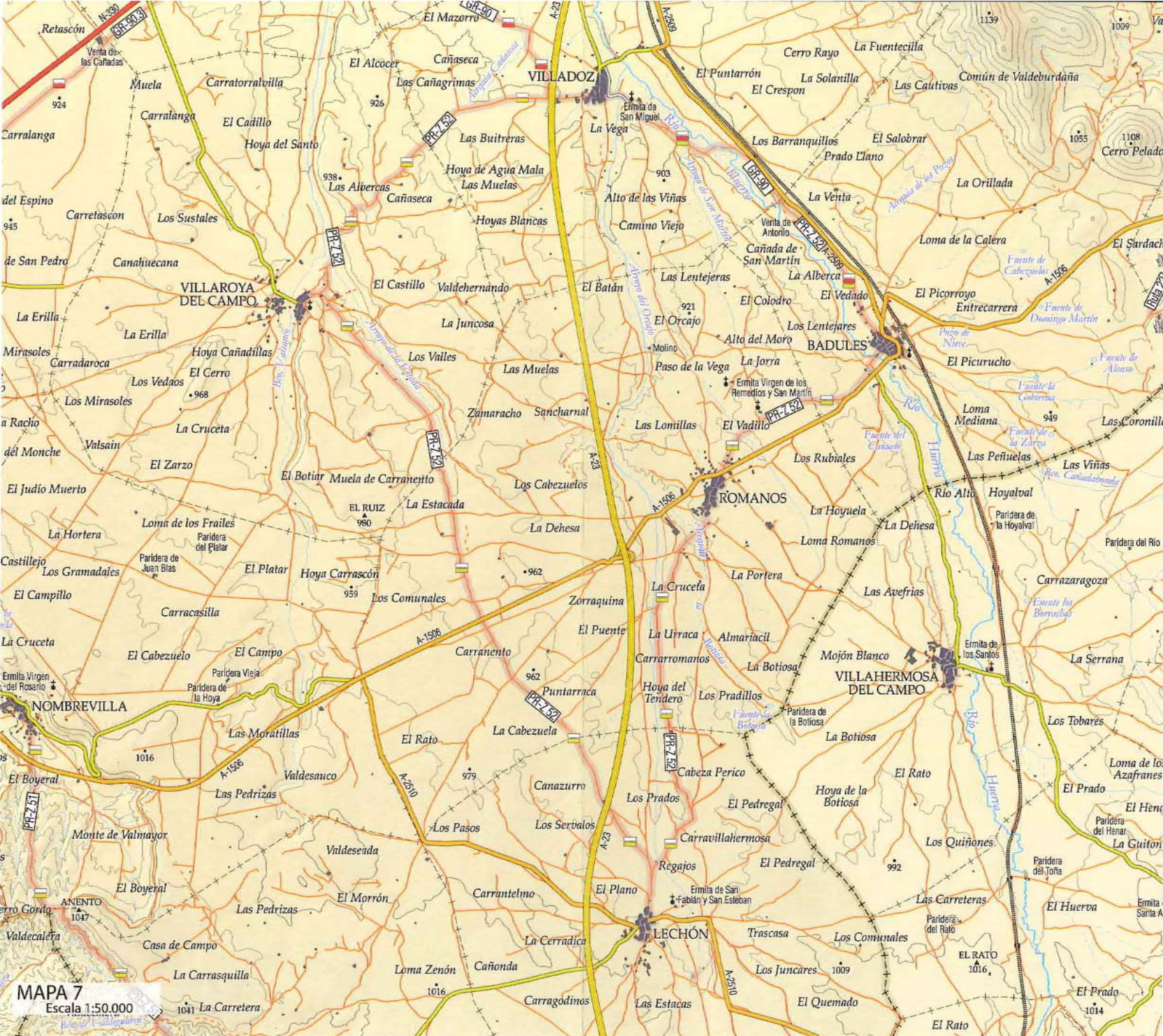
MAPA 7 Escala 1:50.000